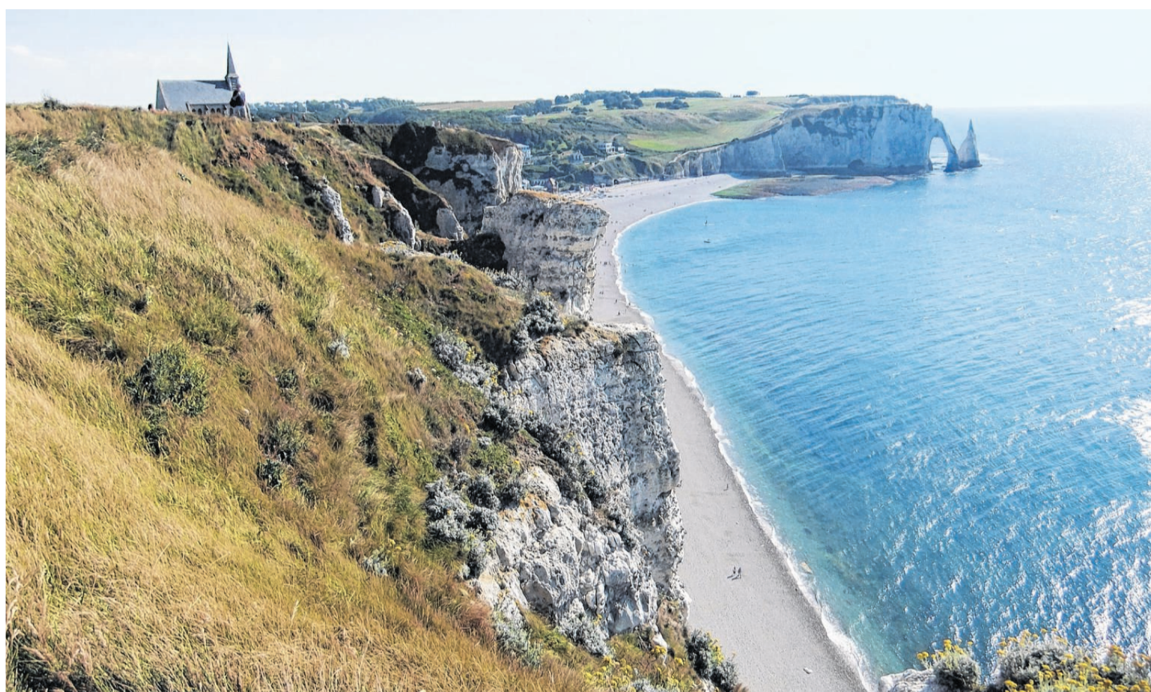
Lange Strände, schroffe Felsen: Die normannische Küste wie hier bei Etretat gehört landschaftlich zu den schönsten am Atlantik.

Auf der Fahrt entlang der Küste Richtung Osten wird der herbe Charme der Normandie spürbar. Die Abwechslung zwischen traumhaften Sandstränden und schroffen Steilküsten ist die eigentliche Attraktion. Im Ferienmonat August sind Badeorte wie das einst so mondäne Houlgate mit seinen schmu-