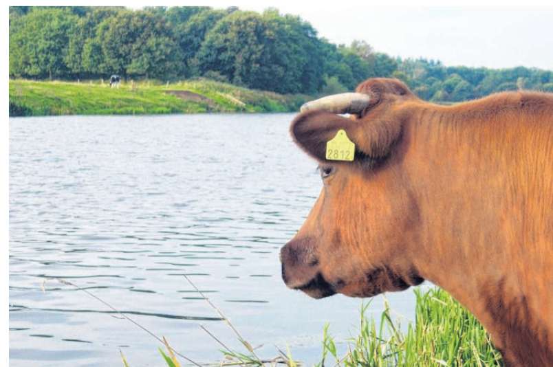
Tierische Aussichten: Einen interessierten Blick auf die Vechte werfen nicht nur Touristen, sondern auch die Kühe, die längs des Ufers weiden.

Sieben Stationen – Bauernhöfe und Restaurants – hat die Smaak-