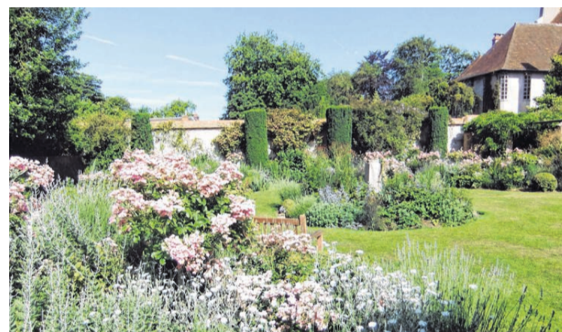
Les Bois des Moutiers heißt ein zwölf Hektar großer Park mit verschiedenen Gärten in der Nähe von Dieppe, der ab 1898 angelegt wurde.

Ziegenhof Wer allerdings mehr auf lebende Tiere steht, sollte einen Abstecher zum Ziegenhof Le Valaine in Etretat einplanen. Bernard und Alpine Dherbécourt beliefern Spitzenrestaurants mit ihren Produkten aus Ziegenmilch: vom Käse über Eis bis zu Pralinen. 60 glückliche Ziegen und ein noch glücklicherer Bock sind das Kapital des Betriebs. Der neue Bock ist übrigens ein Schwabe. Er heißt Freudenschrei und kommt aus dem Raum Stuttgart. Künftig